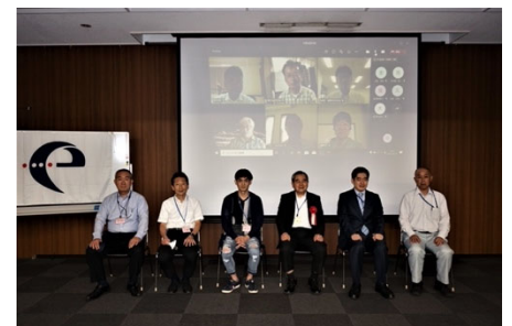
新規合格者（参加者）と九州本部長

公益社団法人 日本技術士会 九州本部は、 技術士試験（一次および二次）に合格された貴殿の 今後のご活躍につながる研鑽を積極的に支援させて 頂きます。 是非、ご参加ください。